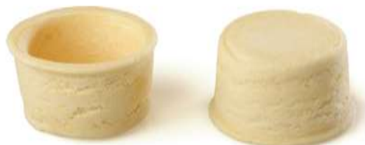
IMMAGINE RAPPRESENTATIVA DEL PRODOTTO